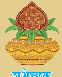
शुभेच्छुक पोलीस ठाणे दवनीवाडा

गोंदियावासियों को दिपावली एवं नववर्ष की हार्दिक शुभकामनाएं