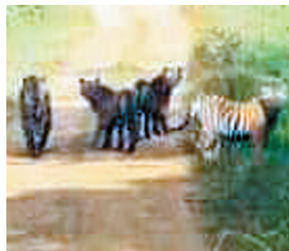
तिची ४ पिछे आढळून आली. गोरेगाव तालुक्यातील मुंडीपार

गोंदिया : नवेगाव नागझिरा व्याघ्र प्रकल्पाच्या नागझिरा अभयारण्य परिसरात दिवाळीच्या सुट्ट्यामध्ये आनंद घ्यायला आलेल्या पर्यटकांना ५ वाघांचे एकत्र दर्शन झाल्याने पर्यटक व इको गाईडमध्ये आनंदाची लाट पसरली आहे. शुक्रवारी सकाळी टी ४ वाघिणी आणि तिचे ४ प्रौढ शावक मनसोक्त फिरत असल्याचे दिसल्यानंतर पर्यटकांची संख्या नक्कीच वाढेल, अशी अपेक्षा आहे. आठवडाभराच्या सुट्टीनंतर शुक्रवारी पर्यटन सुरू झाले आणि सकाळी पिट्झरी ते नागझिरा संकुलाकडे जाणाऱ्या बुधा बुधीजवळ टी ४ वाघिणी आणि